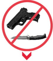
HER TÜRLÜ KESİCİ, DELİCİ ALET VE ATEŞLİ SİLAH