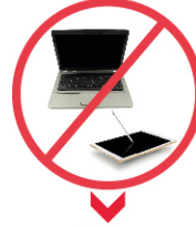
CEP BİLGİSAYARI, BİLGİSAYAR ÖZELLİĞİ BULUNAN CİHAZLAR