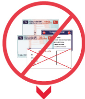
EHLİYET VE KURUM KİMLİK KARTLARI