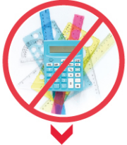
HESAP CETVELİ, HESAP MAKİNESİ