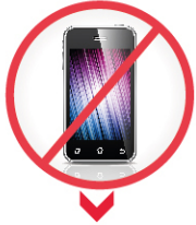
CEP TELEFONU, ÇAĞRI CİHAZI, TELSİZ