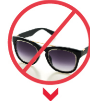
HER TÜRLÜ PLASTİK VE GÜNEŞ GÖZLÜĞÜ DAHİL CAM EŞYA