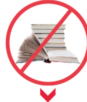
MÜSVEDDE KAĞIT, DEFTER, KİTAP, SÖZLÜK