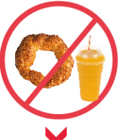
YİYECEK, İÇECEK VB.