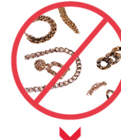
BİLEZİK, KÜPE, HER TÜRLÜ TAŞLI YÜZÜK, BROŞ VB.TAKI