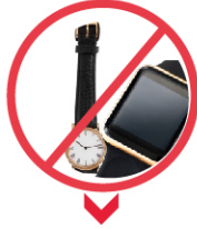
HER TÜRLÜ SAAT VE SÖZLÜK İŞLEVİ OLAN AYGITLAR